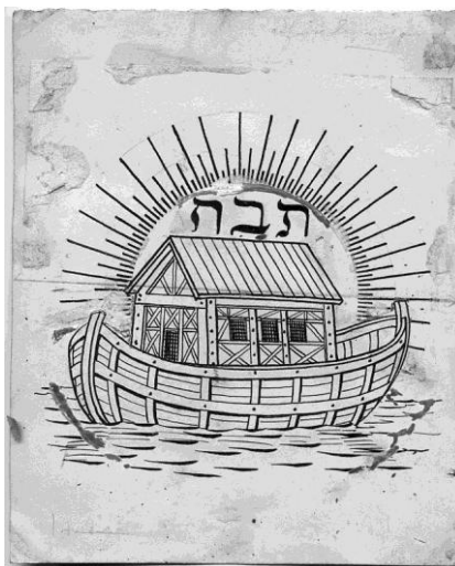
Dessin de Gallo, vers 1900